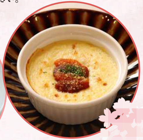
豆乳と湯葉入り うにグラタン