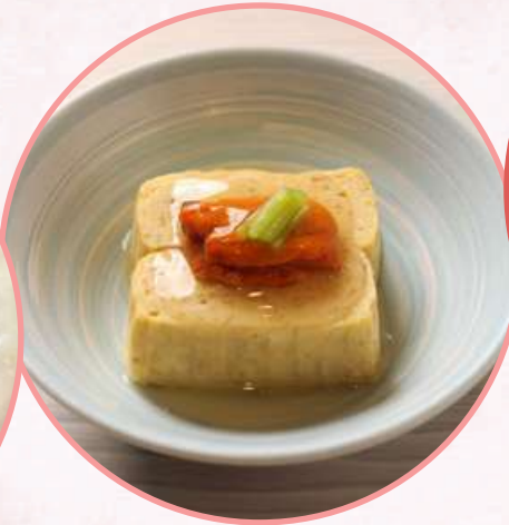
うに乗せふわとろ 出し巻き玉子